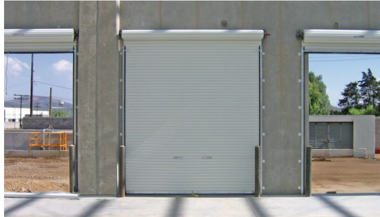
*Imagen representativa de uso.